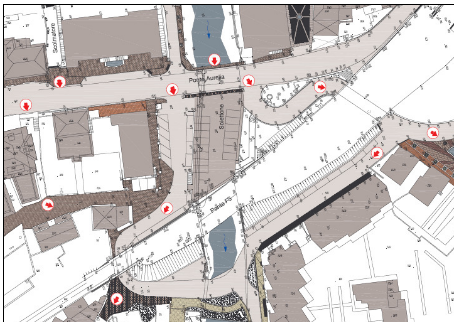
Planimetria e indicazioni di dettaglio: flussi di esondazione a valle della Strada Provinciale Aurelia

Potenzialmente meno critico apparirebbe invece lo scenario relativo ai cosiddetti rii minori, affluenti del Torrente San Lorenzo e lo stesso Rio Inferno della Località Ponticelli che però, soprattutto in occasione di eventi particolarmente intensi, anche se di breve durata e spesso in concomitanza con fenomeni franosi lungo le sponde, con contestuale anomalo incremento del trasporto solido, possono determinare episodi anche gravi di allagamento per esondazione o per rigurgito soprattutto in corrispondenza di sezioni non idraulicamente verificate (ad esempio per attraversamento di strade con tombini di sezione insufficiente).